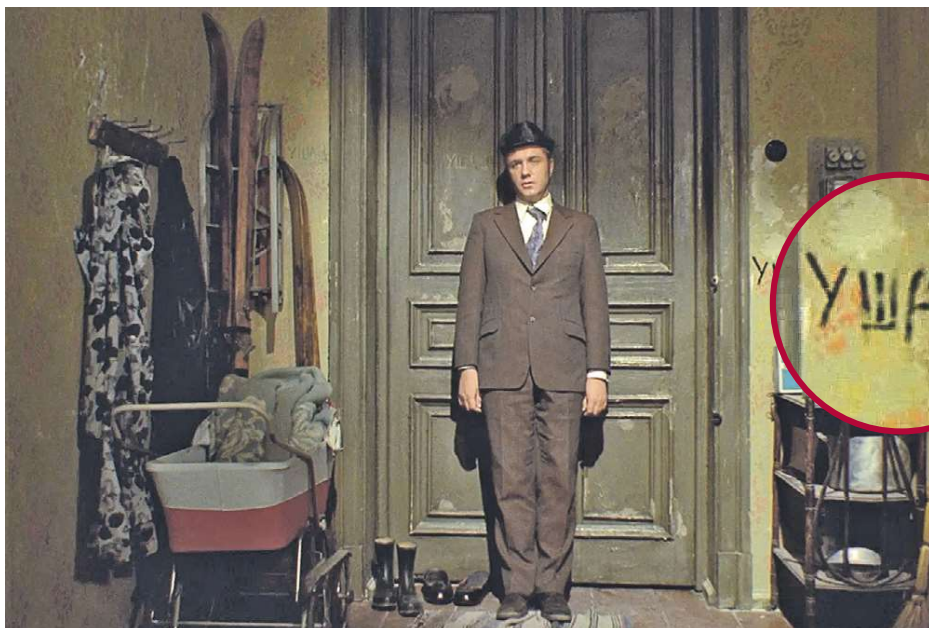
Леонид Куравлев в «Афоне», а на стене слева от него надпись «Ушац», 1975 год