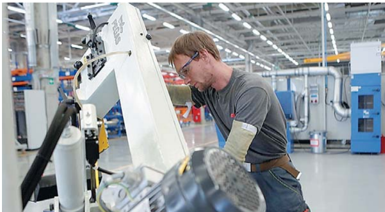
Сотрудники 299 профессий нужны на 140 крупных промышленных предприятиях региона.

Так в чем же причина кадрового голода? Один из основателей Самарского кадрового